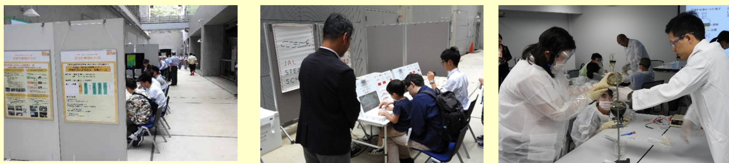
< 未来の科学者のための駒場リサーチキャンパス公開 >