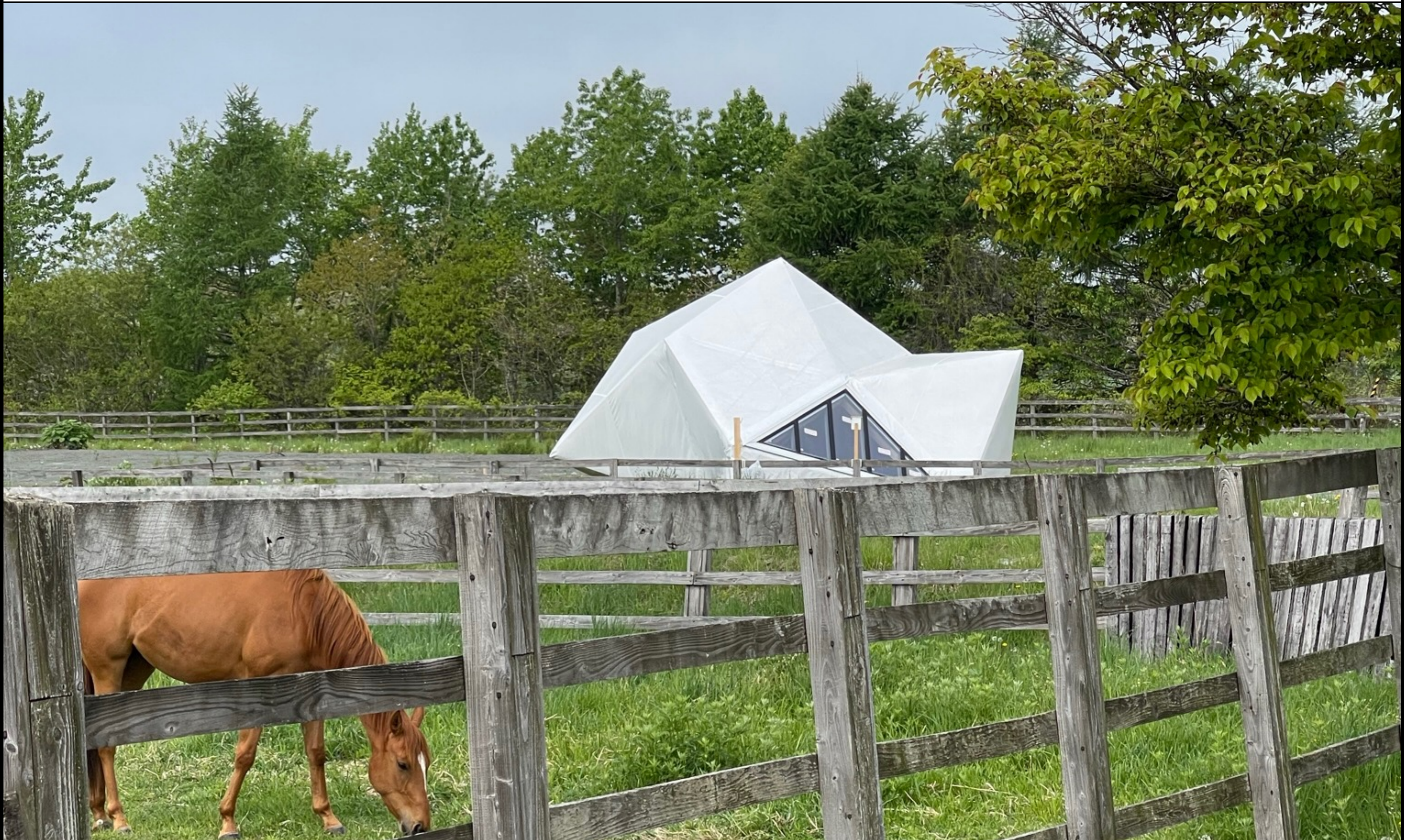
原寸大プロトタイプ