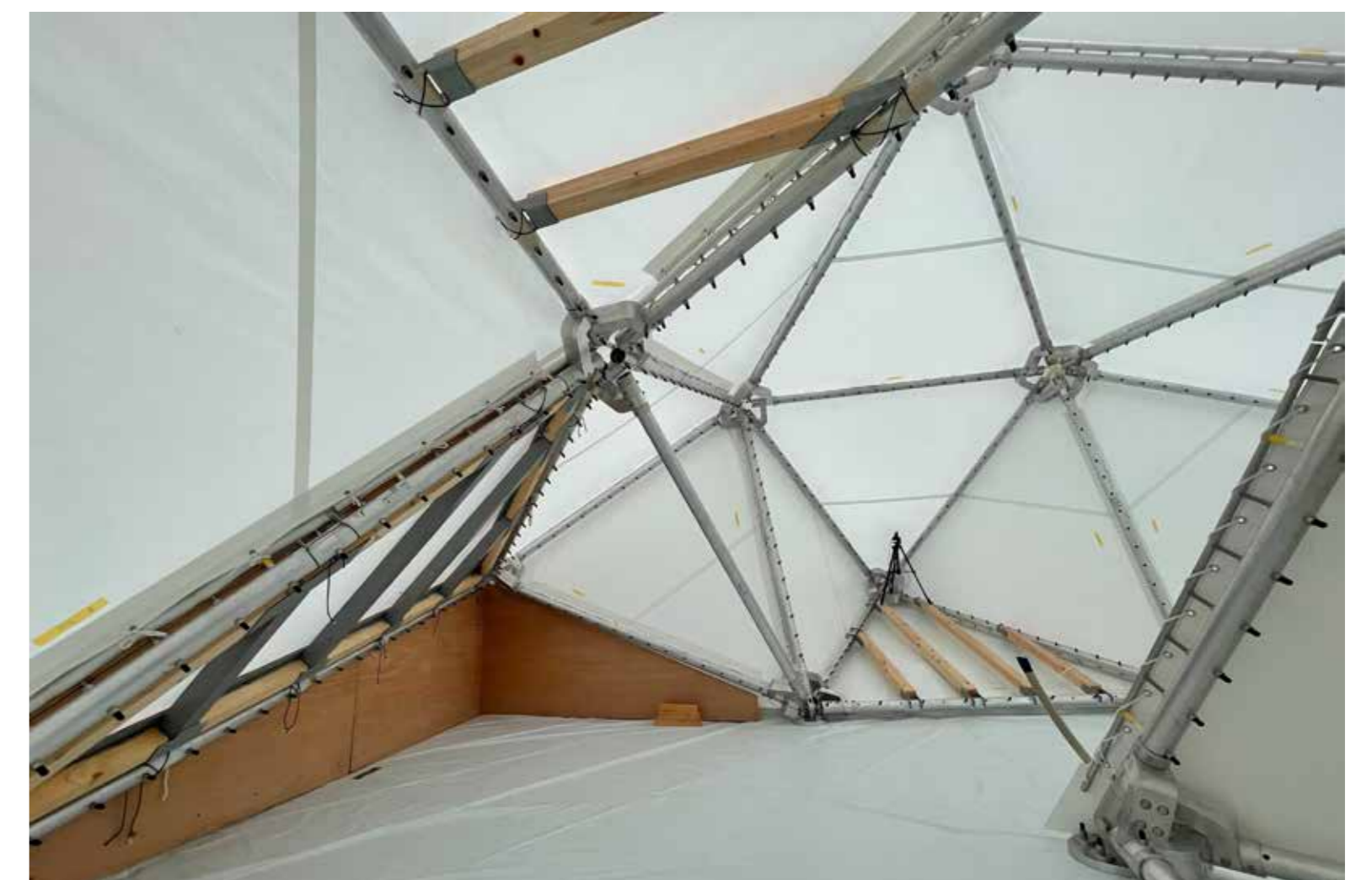
ワンルームの中に様々な居場所がある内部空間