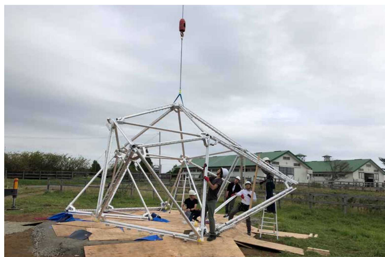
地組した架構の吊り上げの工程

の形に間取りと住宅の形を決めて組み立てることができ、ジョイントの交換や接地条件の設定で住宅の形態を変更できます。軽量のアルミパイプと特別なデザインのフレキシブルな回転機構を持つジョイントで骨組みができていますので、誰でも分解して持ち運び・組み立てが自由にできます。UTokyo Ushioda Memu Earth Labにおける原寸大プロトタイプの建造を通じて、施工性とユーザビリティを確認するとともに、建造後の構造と環境モニタリングを行いシステムの改善を図り、将来的な社会実装を目指しています。