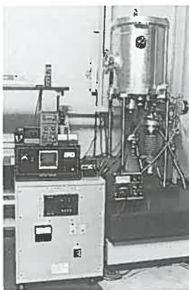
● 図1 超微小押込試験機

込試験機を示します。この測定機の荷重と変位の分解能はそれぞれ 10\mu\text{N} (1mgf)、4nmで、加熱装置を備えており約 500^\circ\text{C} までの高温測定が可能です。図2にこの試験機で測定した、Ni結晶とMg-Zn-Y準結晶の荷重-変位曲線を示します。典型的な金属結晶であるNiと比べて準結晶は最大押込深さが小さく、硬度が高いことがわかります。解析の結果、この系の準結晶はステンレス鋼と同程度の硬さであることがわかりました。準結晶の荷重-変位曲線のもう一つの特徴は、除荷過程での回復（変位のもどり）が大きいことです。このことは準結晶が弾性的には軟らかいことを示しています。このように弾性的には軟らかい準結晶が高い塑性硬さを示す理由は、準結晶構造に起因して転位の易動度が極端に低いためと考えられます。この他にも準結晶の硬さの温度依存性が特異なふるまいをすること等がわかりました。現在、単結晶試料を用いて準結晶の塑性を系統的に調べることを計画しており、準結晶の特異な塑性変形機構の解明をめざしています。