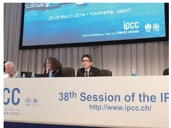
2014年3月横浜でのIPCC総会での様子