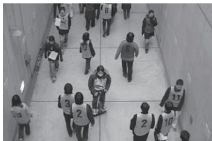
パーソナルモビリティビークル評価実験