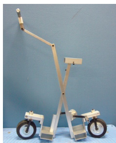
開発中のハイブリッド式パーソナルモビリティ