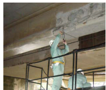
弾性波を用いた検査