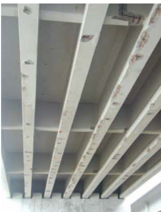
劣化したコンクリート橋梁

年会費 : 試験・計測の実施、検討資料の作成が行えない場合、および新規加入の場合には50万円