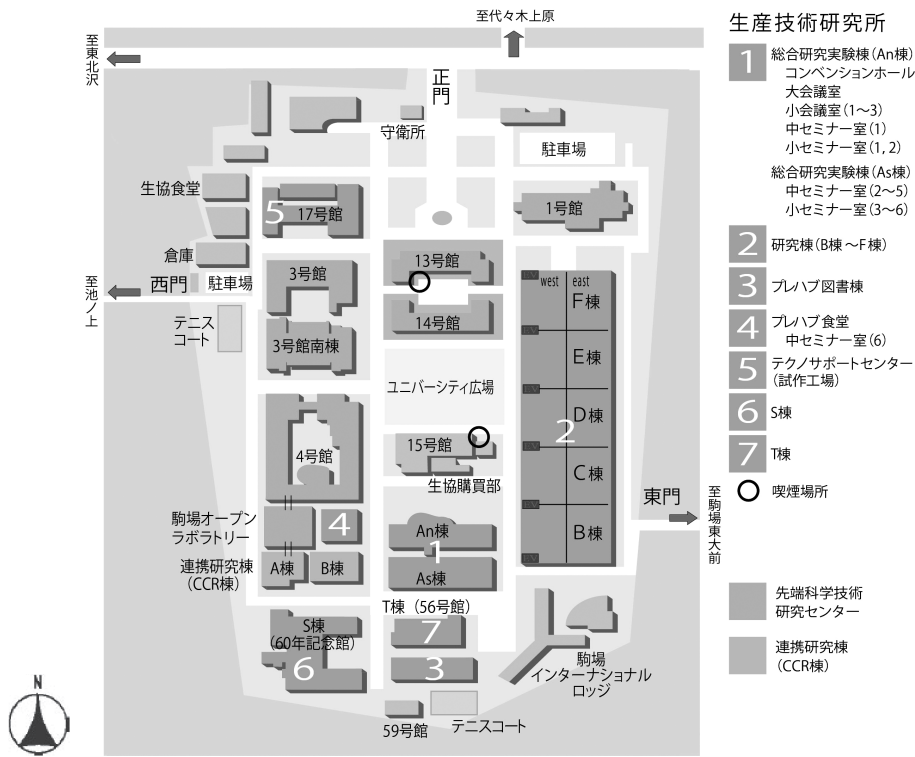
東京大学生産技術研究所（駒場リサーチキャンパス）配置図