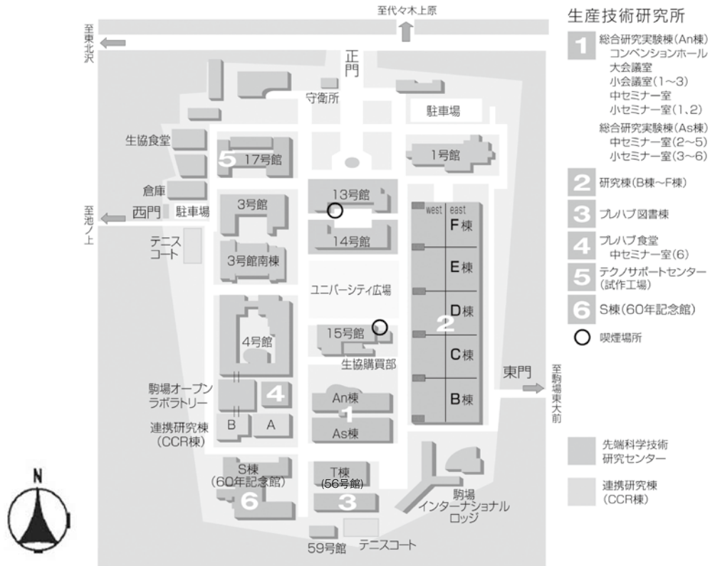
東京大学生産技術研究所（駒場リサーチキャンパス）配置図