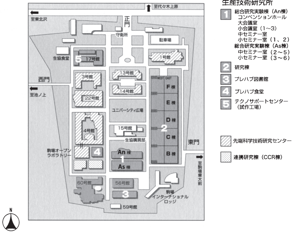
東京大学生産技術研究所（駒場リサーチキャンパス）配置図