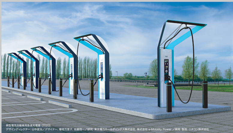
新型電気自動車用急速充電器 (2020)

デザインディレクター: 山中俊治 / デザイナー: 檜垣万里子, 佐藤用一 / 研究: 東京電力ホールディングス株式会社, 株式会社 a-Mobility Power / 開発・製造: ニチコン株式会社