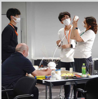
デザインスタジオ

領域を越境しながら活躍するデザイナー・アーティスト・研究者・実業家を呼び、プロジェクトの背景にある「デザイン駆動」の思想を探るオムニバストーク。