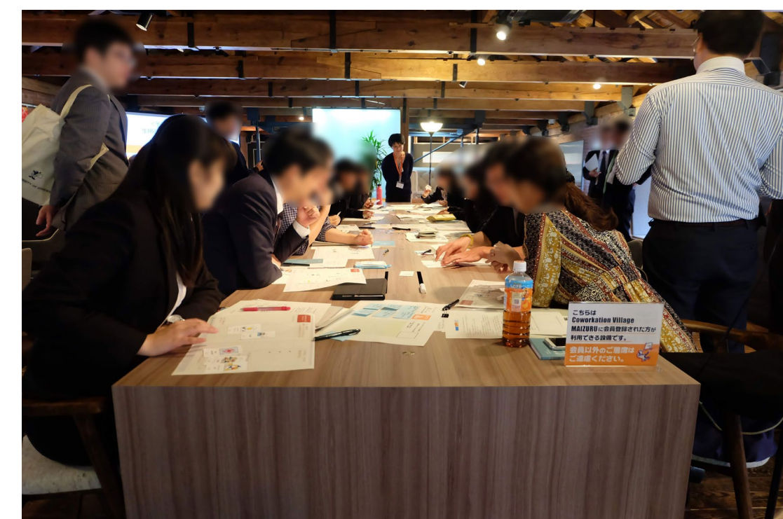
生産技術研究所の地域連携活動で使用したツールを活用した未然課題抽出WSの開催