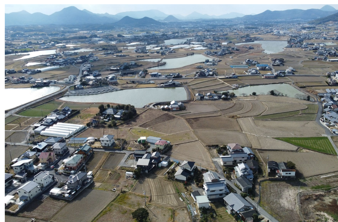
①人口密度が低い地域での社会と空間の調査 (写真) 香川県綾歌郡綾川町畑田の風景