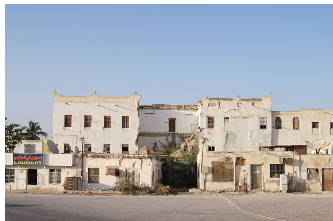
②アラビア半島オマーンでの伝統家屋の保全 (写真) サイクロンで破壊された伝統家屋