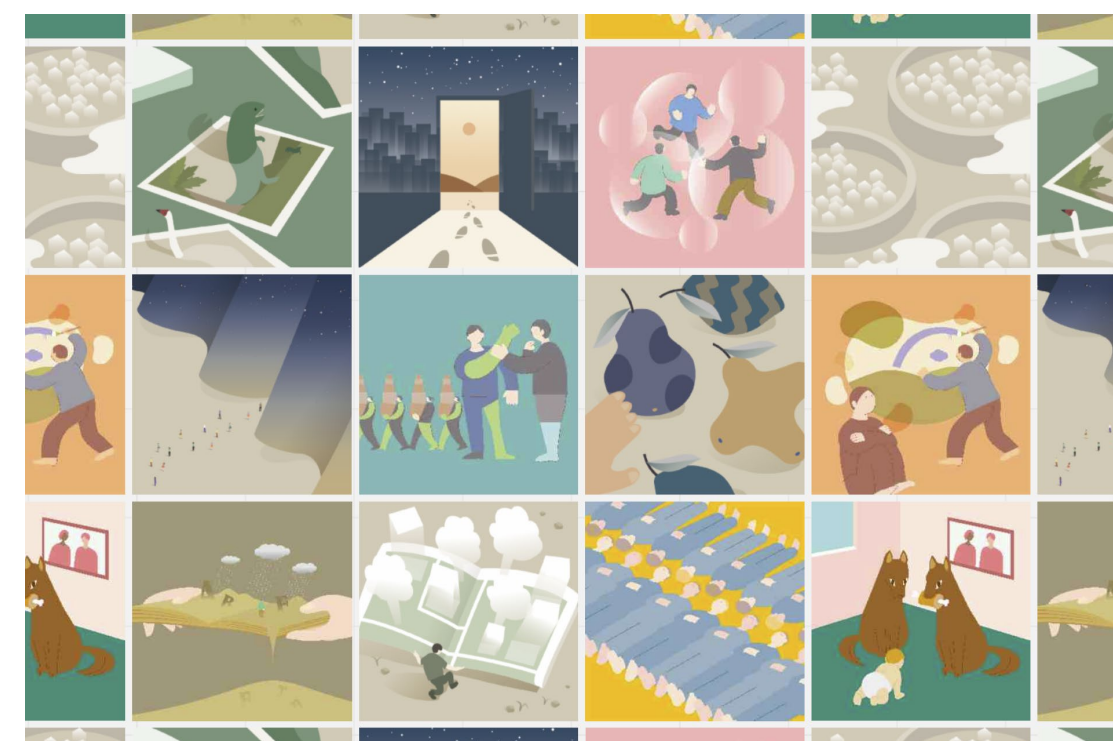
スペキュラティブデザインを応用した全国の高校生を対象としたオンラインWSの開催