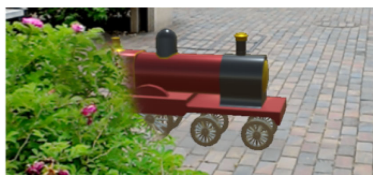
意味的情報による遮蔽処理