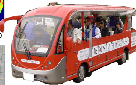
移動型複合現実感システム

周辺環境認識や自己位置姿勢推定、複合現実感における実世界とのインタラクションには実時間で高解像度の奥行マップを取得する必要があります。しかしLiDARやカメラは計測精度と密度がトレードオフの関係にあるため、それぞれの長所を生かして高密度・高精度な奥行マップを実時間で取得する研究を行っています。またこの奥行マップを用いた遮蔽処理手法の開発なども進めています。