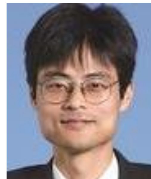
枝川 圭一 教授