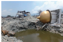
地震発生直後の現地調査