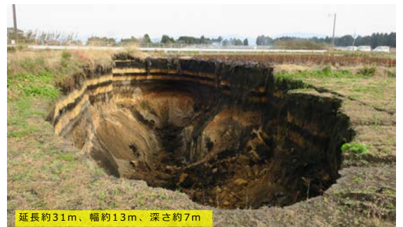
都城・宮崎県の畑で起きた、豪雨によるシラス層の内部侵食による陥没（2016年9月）

地下水の水みちに沿って地盤の一部が侵食され空洞の成長が得意 侵食が進んで空洞・ゆるみが成長 空洞天井部が崩落 それらを繰り返して空洞部が拡大しながら上方に移動