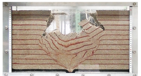
室内模型実験による、土砂流出、空洞生成・拡大、陥没メカニズムの再現

流出孔から地下水位以下の土砂が水と共に流れ出し空洞が生成・拡大 空洞天井部が地表面近くまで達し、空洞上部が不安定 空洞上部の土が崩落し陥没