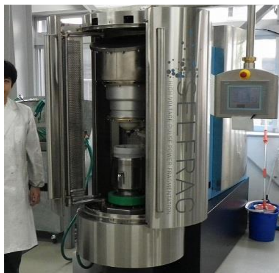
電子基板から部品をできるだけ壊さずに剥離することが可能な電気パルス破碎装置