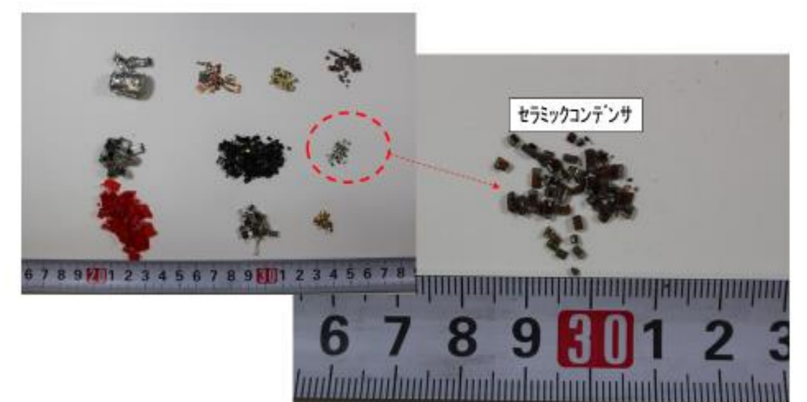
このように分離したセラミックコンデンサー中のPd濃度は約3%前後