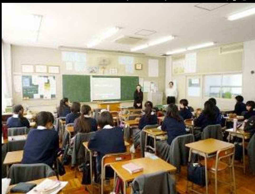
出張授業の企画・実施

生産技術研究所で行われている最先端工学研究を取り入れた産学連携による工学教育・アウトリーチ活動を企画・実施