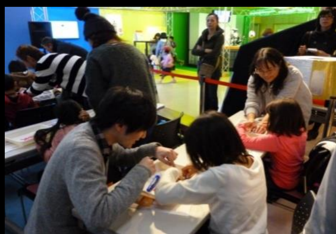
ワークショップの企画・実施