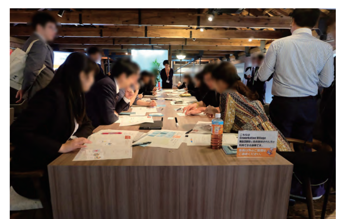
生産技術研究所の地域連携活動で使用したツールを活用した未然課題抽出WSの開催