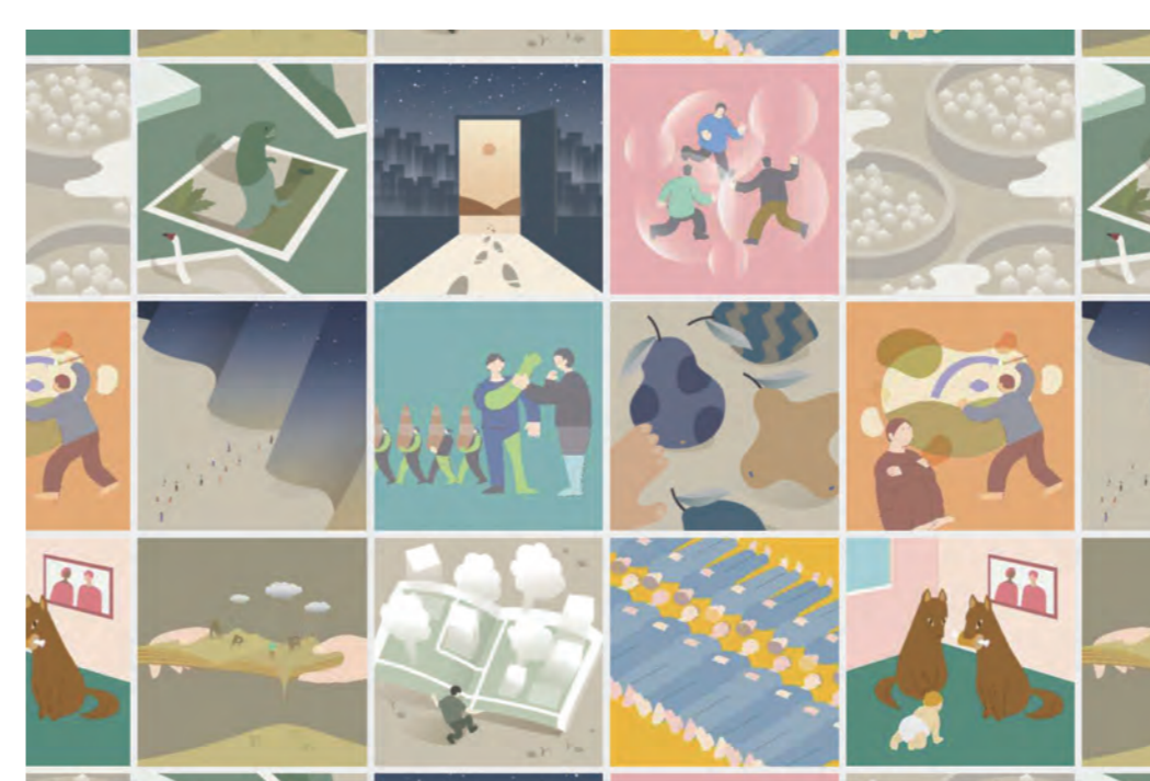
スペキュラティブデザインを応用した全国の高校生を対象としたオンラインWSの開催