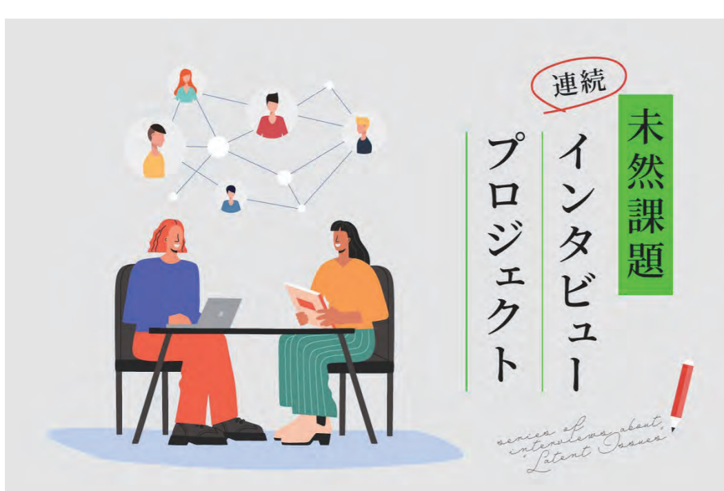
「未然課題」を共通テーマとした所内研究者への連続インタビューの実施