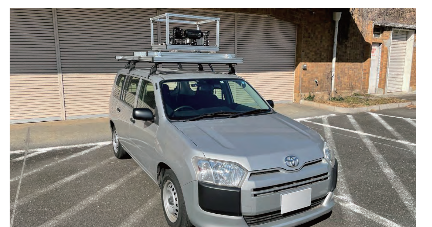
車載高速ビジョンシステム

高速ビジョンシステムを用いて、車両と車両を取り囲む周辺環境の高速かつ高精度な認識を行うことで、先進運転支援システム及び自動運転の高度化に資するセンシング技術を研究しています。例えば、危険領域の早期検出による死角からの飛び出し検出の高速化や、高速・高精度な車間距離・速度・加速度推定による隊列走行の効率化を研究しています。