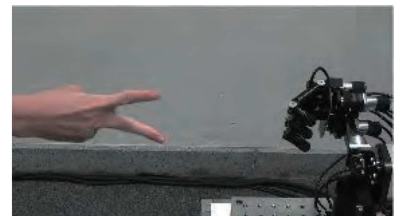
勝率100%じゃんけんロボット

高速ビジョンと高速ロボットハンドを用いて、人間の動作に低遅延で反応し、高速に追従する技術を応用することにより、人間との協調動作・人間の作業支援・人間の運動機能拡張等を研究しています。応用例として開発した勝率100%じゃんけんロボットは、動画投稿サイトにおいて500万回以上の再生回数を記録し、世界中で注目されています。