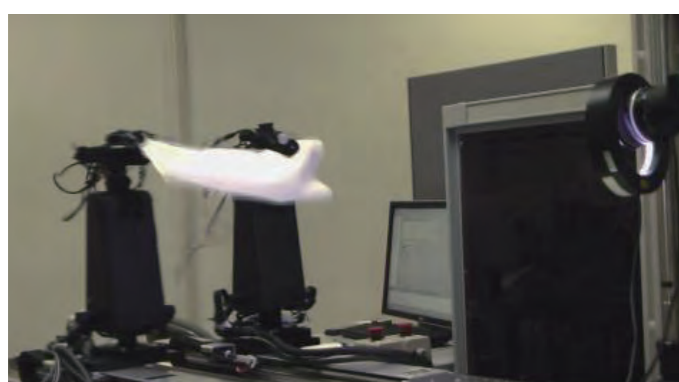
布の動的折りたたみ操作