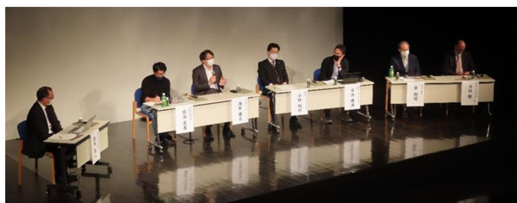
【ITSセミナー-in日立 (2022年3月)】