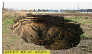
都城・宮崎県の畑で起きた、豪雨によるシラス層の内部侵食による陥没（2016年9月）

地下の水みちに沿って地盤の一部が侵食され空洞の成長がすすむ。それらを探りながら土砂が流出し、空洞上部が不安定になり、空洞上部が陥没し、土が上方へ移動する。