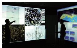
ディスプレイウォール上の大規模時空間可視化システム

ウェブ・ソーシャルメディア等のサイバー空間と実世界は密接に連動しており、サイバー空間と実世界センサーデータの融合解析による社会課題解決を目標とした研究を推進している。1999年から継続的に日本語ウェブページを大規模収集し、数百億URL、数十億ブログ記事、Twitterの数百億つぶやきを含むウェブアーカイブを構築するとともに、ドライブレコーダーデータ、交通トラフィックデータ、気象データ等の実世界データの収集・蓄積を行い、その構造、内容、時間変化等を解析するシステムを開発中である。膨大なサイバー空間・実世界データをデータマイニング、機械学習、リンク解析、自然言語処理、画像処理等を用いて解析し、様々な切り口で探索可能な可視化システムを大規模ディスプレイウォール上に実装している。