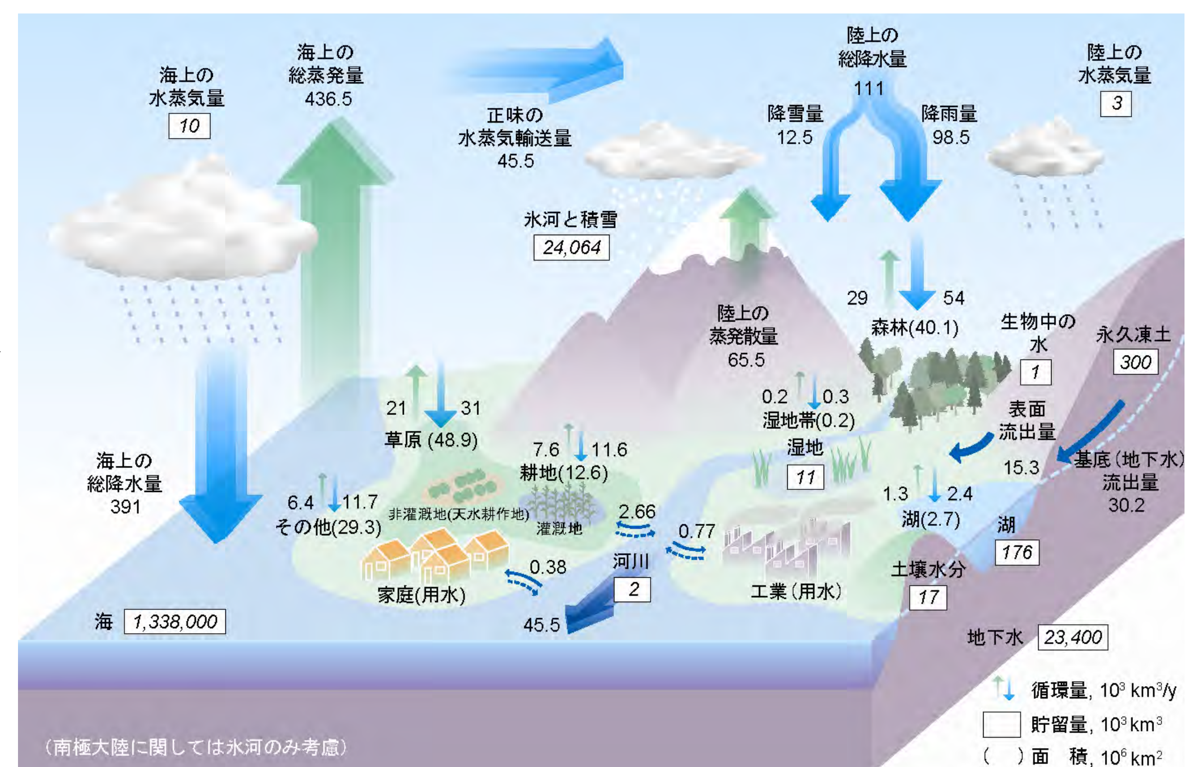
地球上の水循環 [Oki and Kanae (2006)]

世界各地で発生する水不足は、水資源の枯渇というよりはその時間的・空間的偏在性に起因しています。地球規模の水循環変動を推計できる数値シミュレーションモデルは、こうした水問題解決にむけた意思決定に科学的根拠を提供するとともに、洪水や水害、渇水や旱魃といった水リスクが気候変動によってどのように深刻化するかの予測に不可欠です。近年の高解像度衛星データの普及と計算機能力の向上により、広域かつ詳細な水循環の推定が可能になりつつあり、超長期の変動算定や準リアルタイム予測の実現を目指しています。