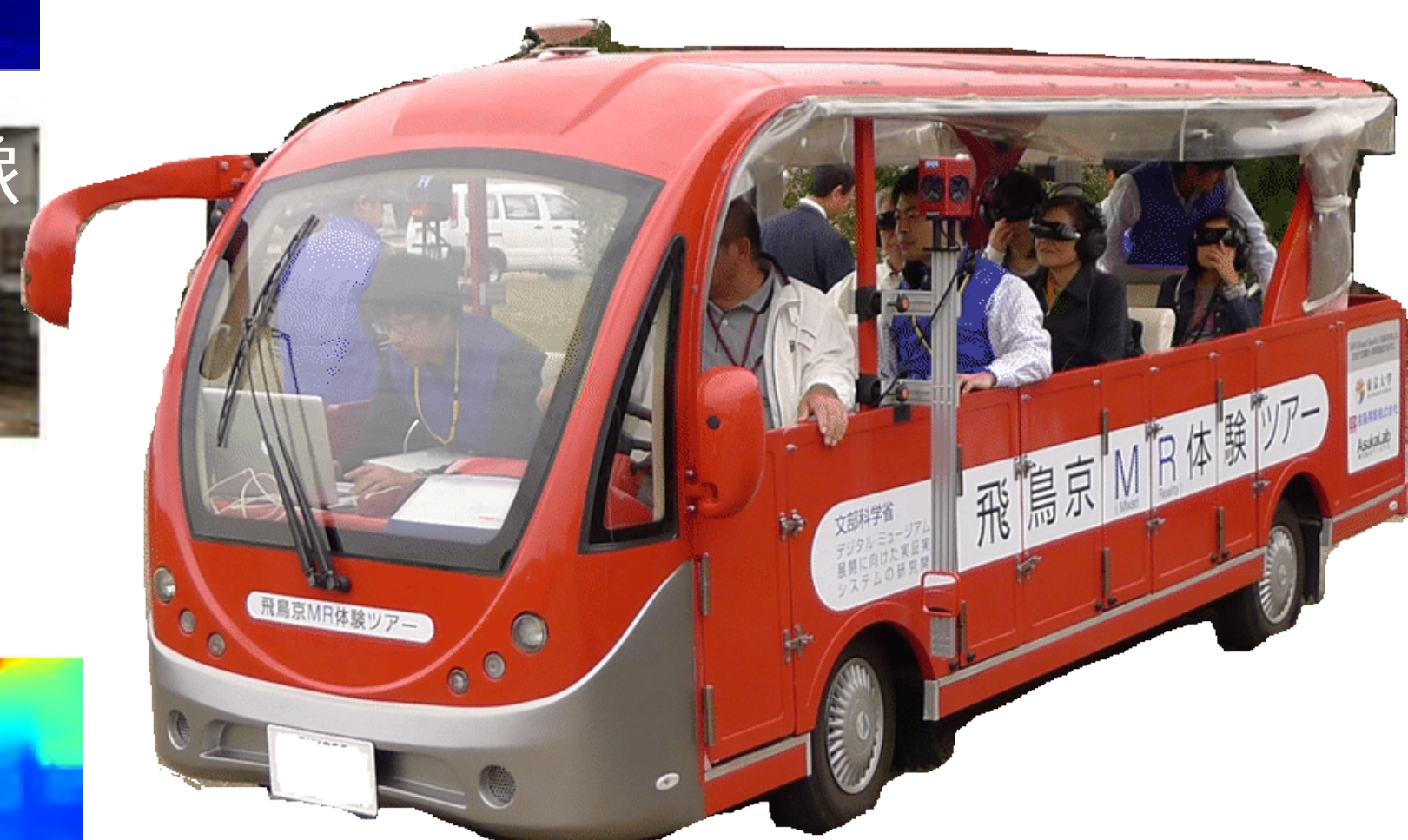
移動型複合現実感システム

周辺環境認識や自己位置姿勢推定、複合現実感における実世界とのインタラクションには実時間で高解像度の奥行マップを取得する必要があります。しかしLiDARやカメラは計測精度と密度がトレードオフの関係にあるため、それぞれの長所を生かして高密度・高精度な奥行マップを実時間で取得する研究を行っています。またこの奥行マップを用いた遮蔽処理手法の開発なども進めています。