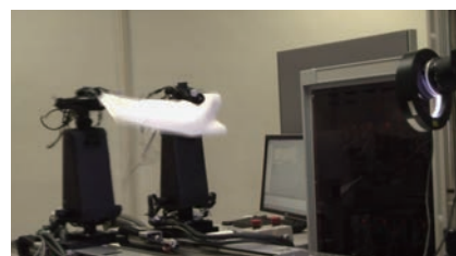
布の動的折りたたみ操作