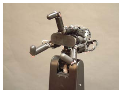
高速ロボットハンド

リアルタイムでのセンサフィードバック、特に高速ビジョンと高速画像処理技術を駆使することで画像情報に基づく高速なロボット制御を実現するとともに、人間の運動速度を超える超高速なロボットを開発しています。例えば、1秒間に180度の開閉運動が可能な高速ロボットハンドを開発しています。