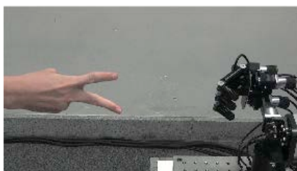
勝率100%じゃんけんロボット