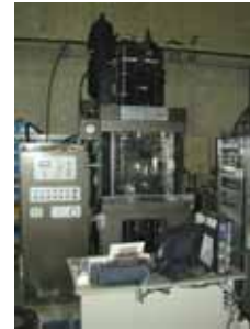
高温高速圧縮試験機