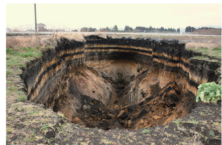
都城畑地の大規模地盤陥没 https://geo.iis.u-tokyo.ac.jp