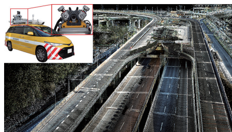
三次元測距レーザーを車載した モバイルマッピングシステム (MMS) によるインフラ形状のサイバー化技術 https://mizutanilab.iis.u-tokyo.ac.jp/