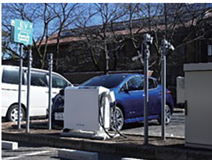
EV 充電テストベッド

運営方法：3ヶ月に一度程度研究会を開催する。また、他のIoT関連団体との協業や、東京大学との共同研究を行う。