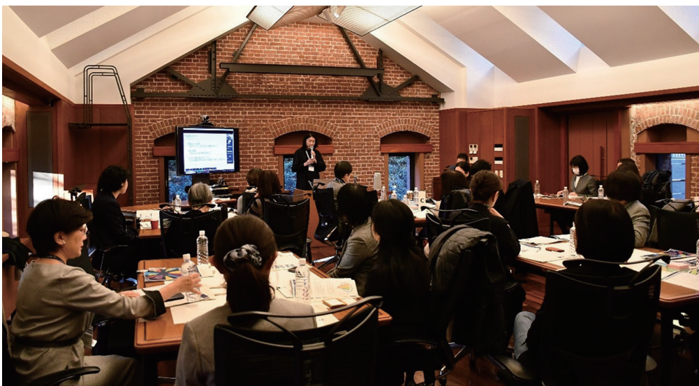
大学の未来を考える女性ネットワーキング

研究者、教育関係者、企業関係者が集い、事例紹介、意見交換、およびネットワーキングを行います。