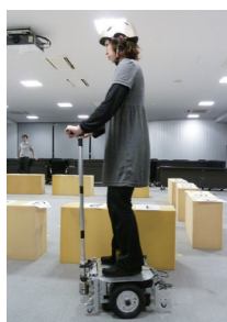
開発中のハイブリッド式パーソナルモビリティ