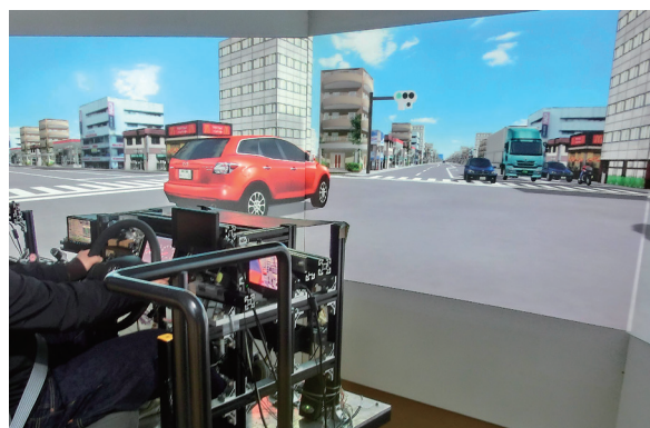
Driving simulator ドライビングシミュレータ