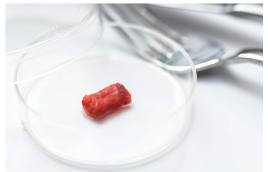
3次元組織構築技術を駆使して作製した培養肉サイコロステーキ