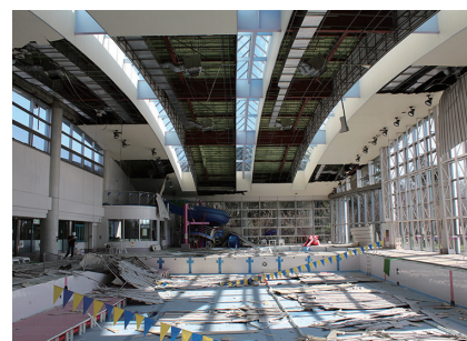
東日本大震災での天井落下事例