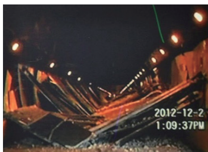
笹子トンネルにおける非地震時の天井落下事故