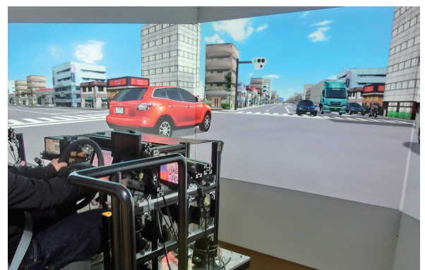
Driving simulator ドライビングシミュレータ