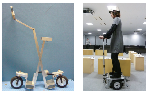
開発中のハイブリッド式パーソナルモビリティ