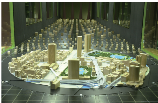
環境無音境界層風洞

モデルケースを設定し、実際に当所保有の環境無音境界層風洞を用いたスタディを実施する。