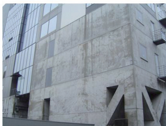
表層品質検査装置と改質技術適用例