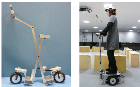
開発中のハイブリッド式パーソナルモビリティ