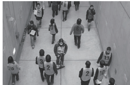
パーソナルモビリティビークル評価実験