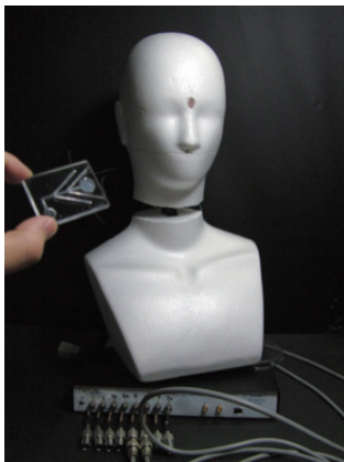
膜タンパク質を特異的に 発現させた匂いセンサを もつロボット