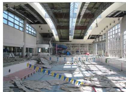
東日本大震災での天井落下事例