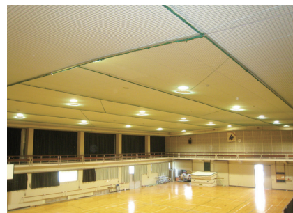
落下防止ネットの設置事例