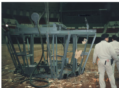
阪神大震災での大型設備機器の落下事例

運 営 方 法：年4回程度（1回3時間程度）の研究会を開催予定 関連分野の研究者・実務者・技術者による講演並びに情報交換・意見交換を行う。