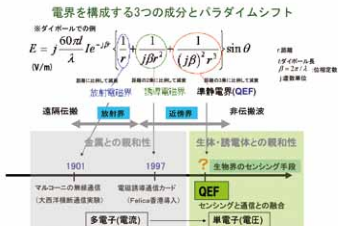
準静電界と他の電磁界との違い