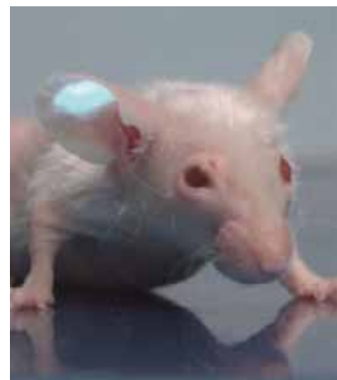
血糖値に応答して光の輝度を 変化させるマイクロビーズが 耳に埋め込まれたマウス