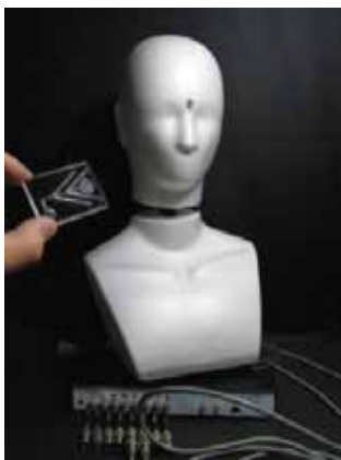
膜タンパク質を特異的に 発現させた匂いセンサを もつロボット