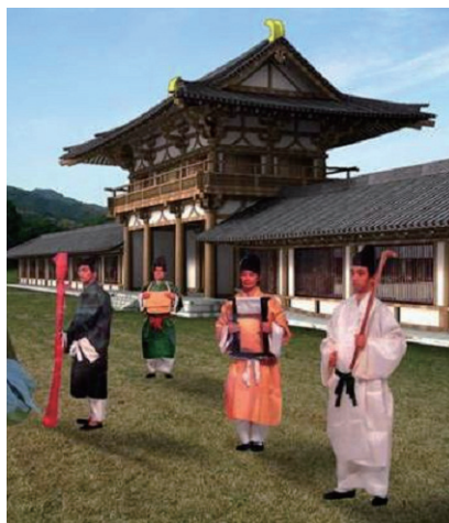
奈良県明日香村の事例：現在の川原寺跡を特殊Googleで車内から望むと往時の姿が再現