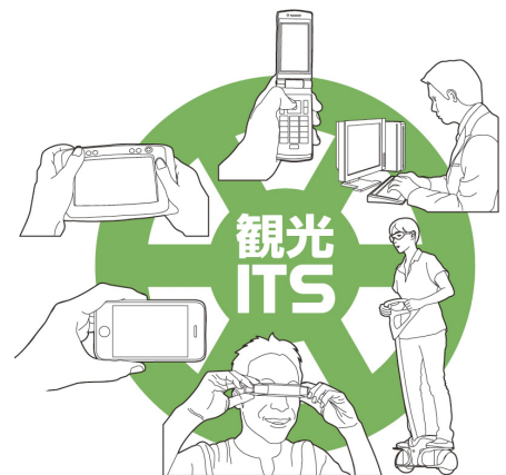
車両とGoogle以外にも様々なメディアと移動手段の組み合わせで観光ITSへ