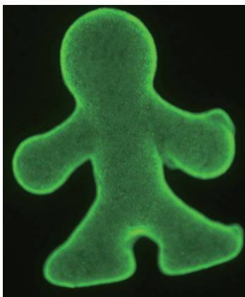
細胞をビーズ状に加工し3次元の鋳型で高速にモールドされた細胞組織構造