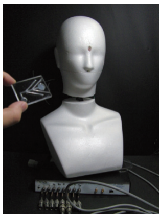
膜タンパク質を特異的に 発現させた匂いセンサを もつロボット