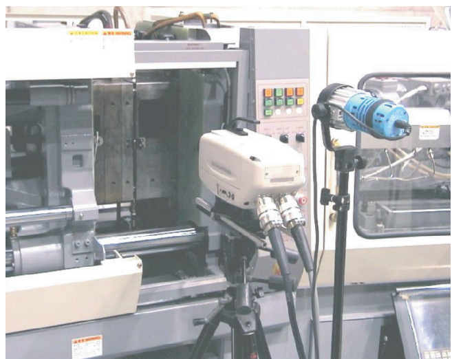
型内充填挙動の直接観察

超薄肉型内充填パターンおよび圧力分布の計測 (キャビティ厚さ0.5mm、偏肉部厚さ0.2mm)