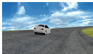
High Speed Oval Track 高速周回路