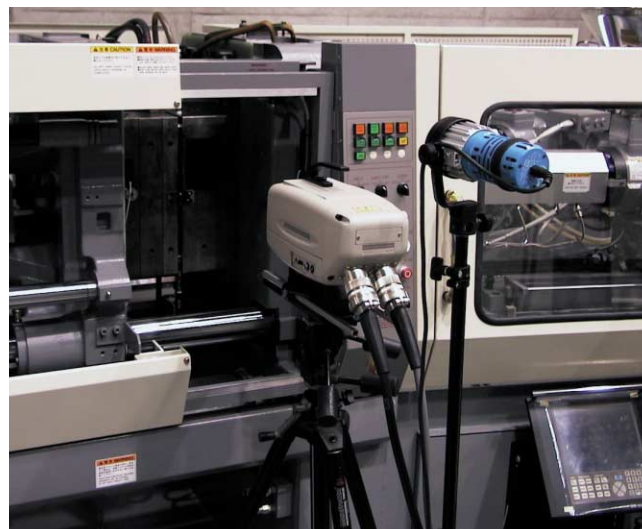
型内充填挙動の直接観察

超薄肉型内充填パターンおよび圧力分布の計測 (キャビティ厚さ0.5mm、偏肉部厚さ0.2mm)