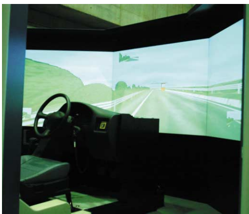
シミュレータ画面