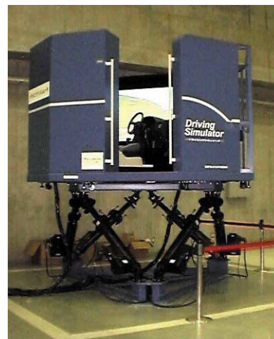
ドライビングシミュレータ